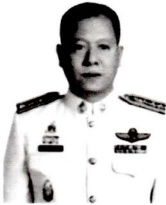
1.พ.ต.อ.อนุพันธ์ สุขุม เบอร์ 1

เขต 2 ประกอบด้วยหน่วยงาน ได้แก่ สถานีตำรวจภูธรเมืองพิจิตร มีกรรมการได้ 1 คน พ้นจากตำแหน่ง ตามข้อบังคับ ข้อ 77(1) จำนวน 1 คน จึงต้องสรรหา จำนวน 1 คน มีผู้สมัคร 1 คน ดังมีรายชื่อต่อไปนี้